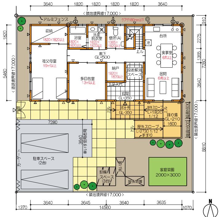
(参考前回木造本試験) 1階平面図兼配置図 平成29年木造2階建

製図受験者10,920人のうち、合格者は5,997人で全国合格率は54.9%でした。例年並みの合格率ですが、受験する人のレベルが年々上がっているため、54.9%に入るためにはミスを極力少なくするよう心がけてください。住人の使い勝手に配慮し、構造的に頑丈に設計して下さい。当学院の合格率が高いのは、良質のオリジナル課題が勝因です。